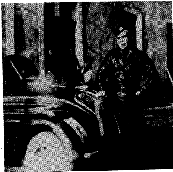
לעבן פּריוואַ אין אַרדעש פּראַנקרייך. סעפטעמבער 1944. גרענאַר.